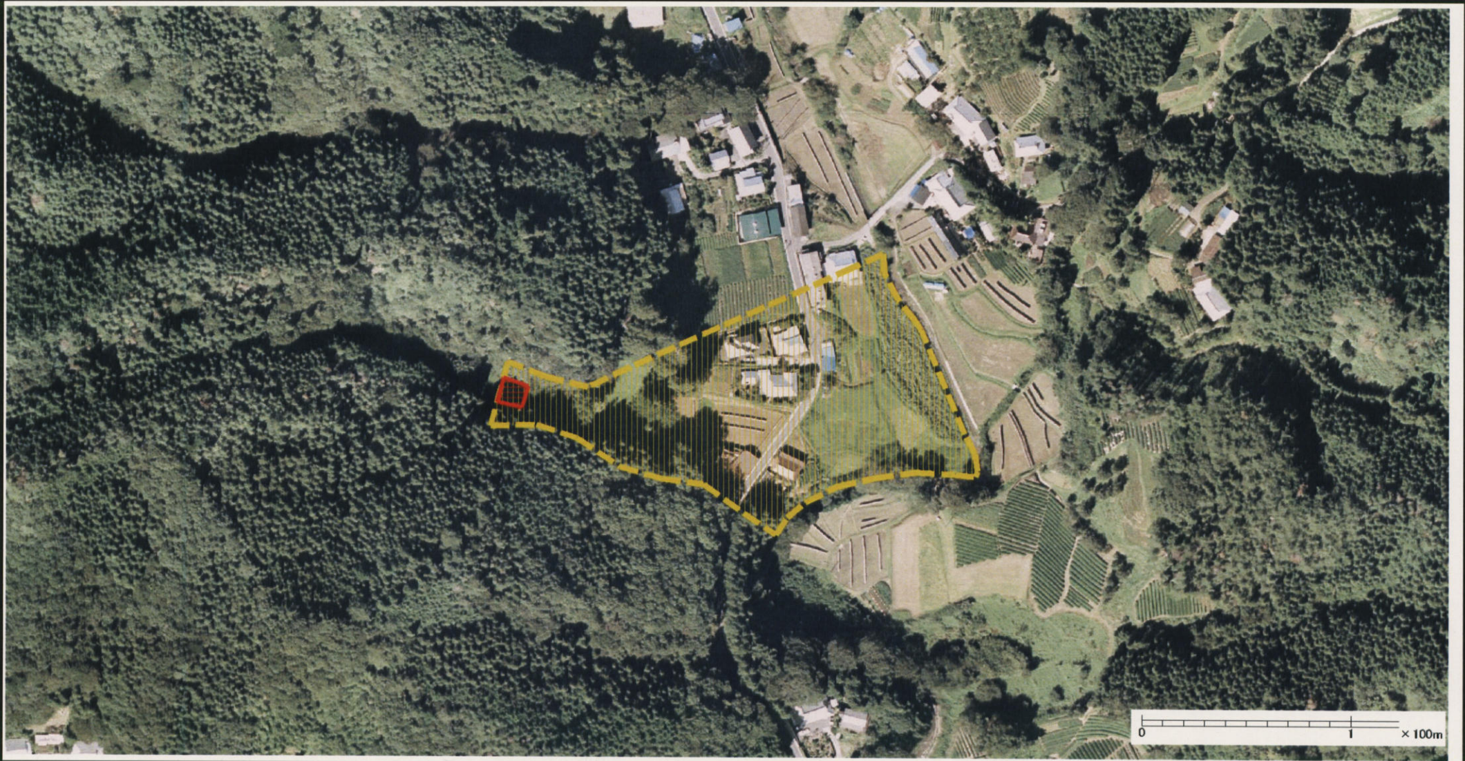
様式-3 (土) 土砂災害警戒区域・土砂災害特別警戒区域 区分図 (その2)