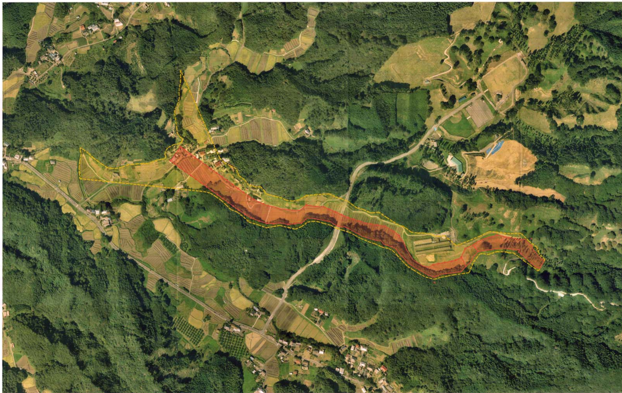
様式-3（土） 土砂災害警戒区域・土砂災害特別警戒区域区分図（その2）