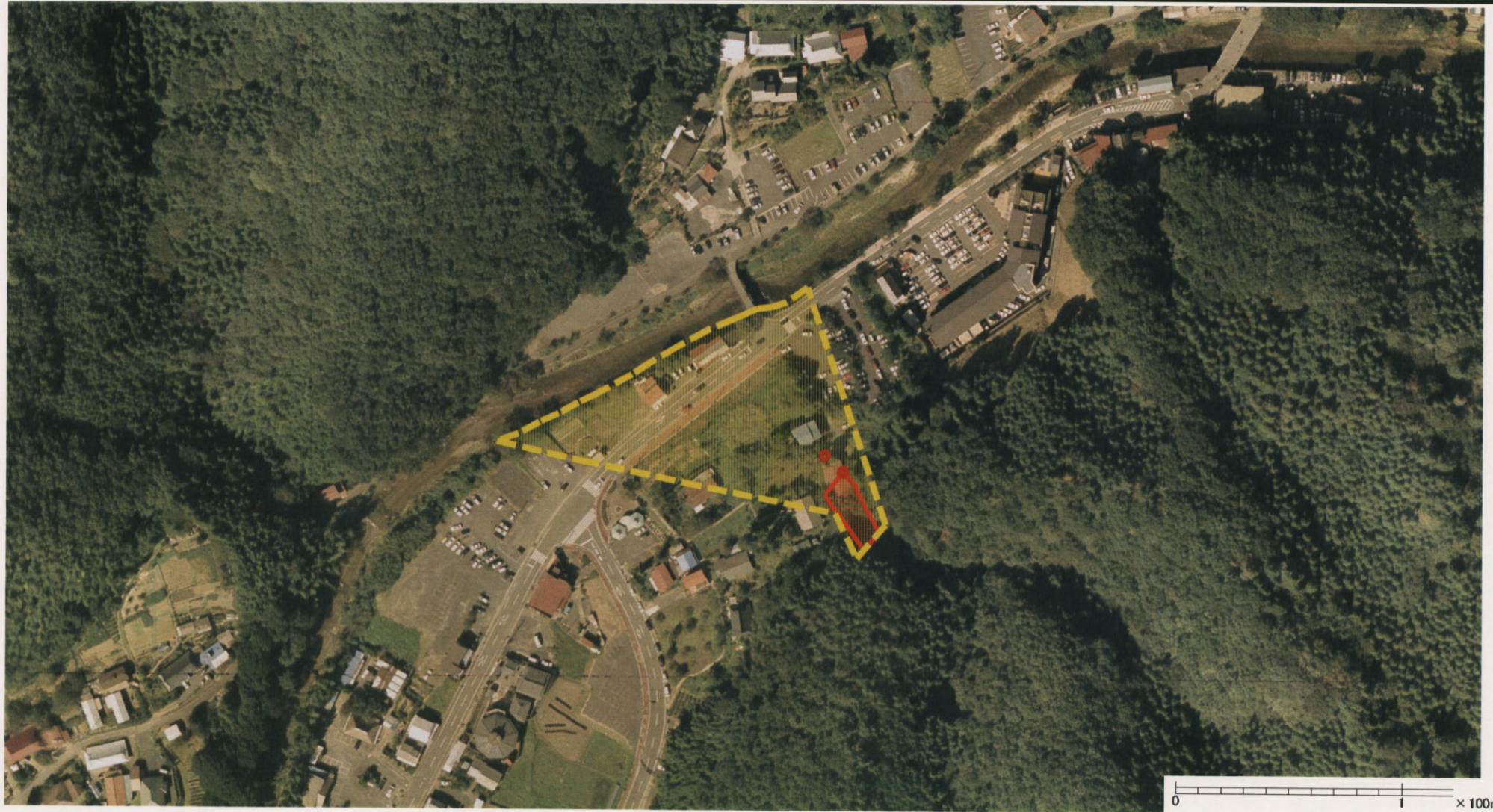
様式-3 (土) 土砂災害警戒区域・土砂災害特別警戒区域 区分図 (その2)