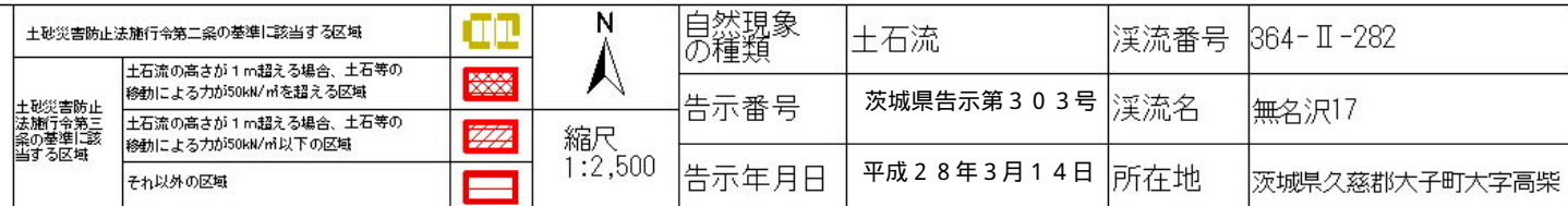
様式-2(土) 土砂災害警戒区域・土砂災害特別警戒区域 区域図(その2)