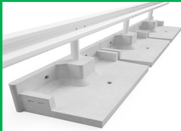
(B-23090) ガードレール用基礎ブロック コンクリート製品協同組合、 茨城大学工学部都市システム工学科