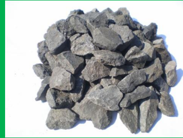
(C-22035) エコラロック 新日本電工(株)