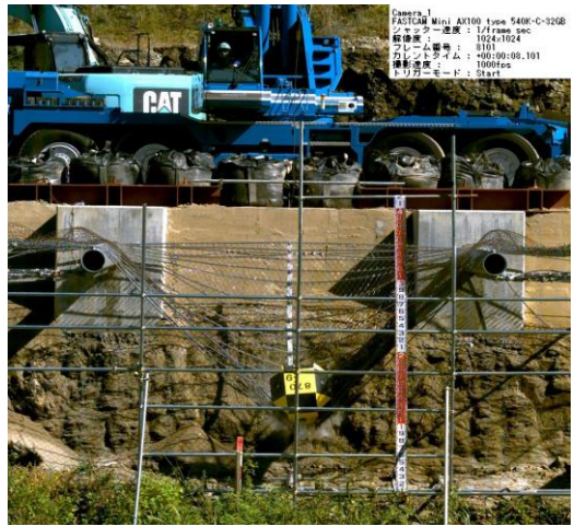
重錘衝突実験状況