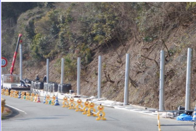
支柱建て込み状況