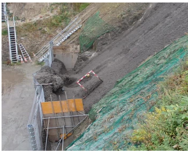
土砂流下実験状況