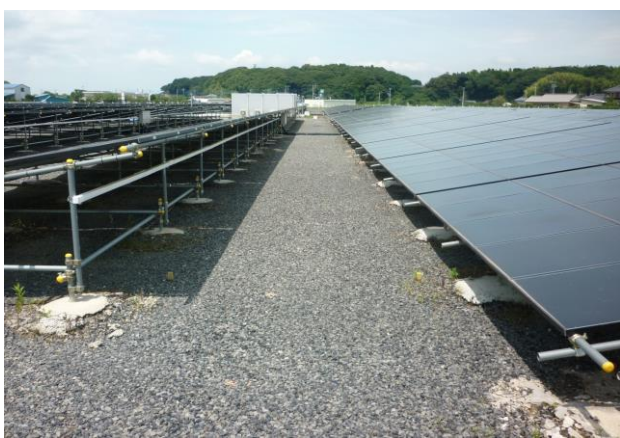
施工例①: 太陽光発電施設の敷き均し材