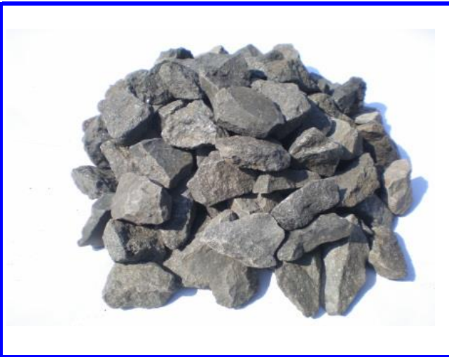
エコラロック拡大写真①