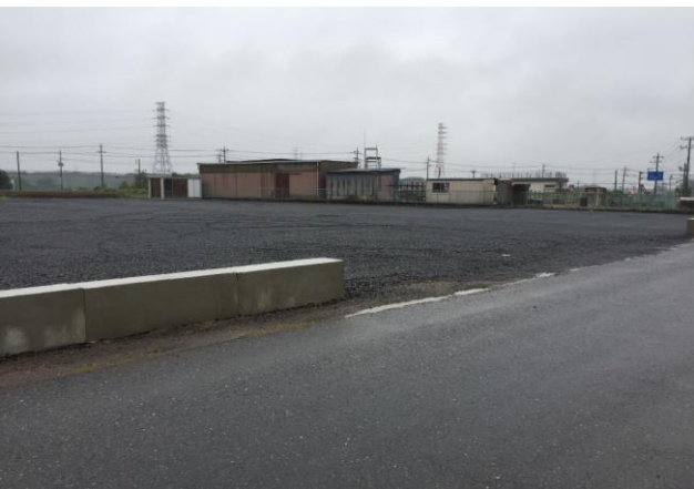
施工例③: 駐車場敷き均し材