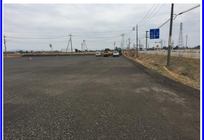
施工例②: 下層路盤材