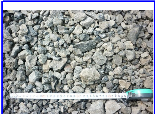
エコラロック拡大写真②