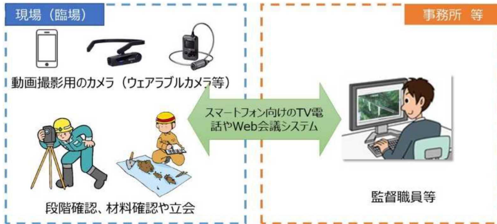
図 2-1 機器構成 (例)