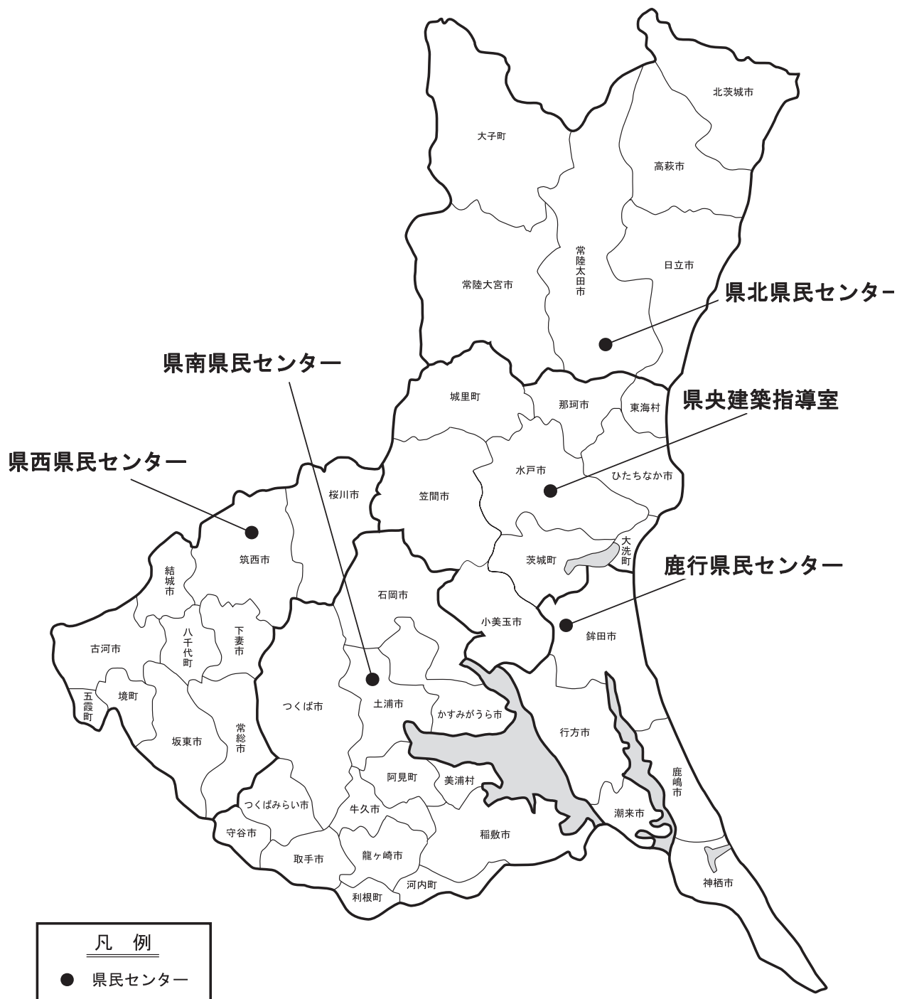
I-4-1 建築指導行政管轄区域図 (H29.4.1 現在)