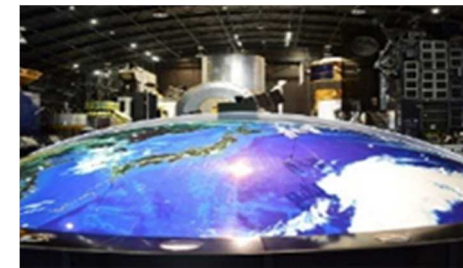
▲ 筑波宇宙センター（JAXA）