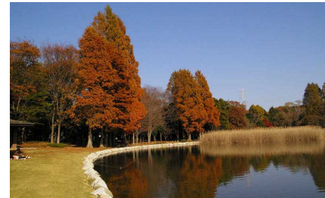
▲ 四季が感じられる樹林