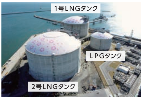
2号LNGタンク(令和3年2月撮影)

同パイプラインが、既存の「鹿島臨海ライン」(神栖市)及び「茨城～栃木幹線」(日立市～栃木県真岡市)と接続し、高圧ガスパイプラインがグループ化したことで、北関東及び首都圏におけるエネルギー供給の安定性が向上し、日立港区のエネルギー関連港湾としての重要性がさらに高まることが期待されております。