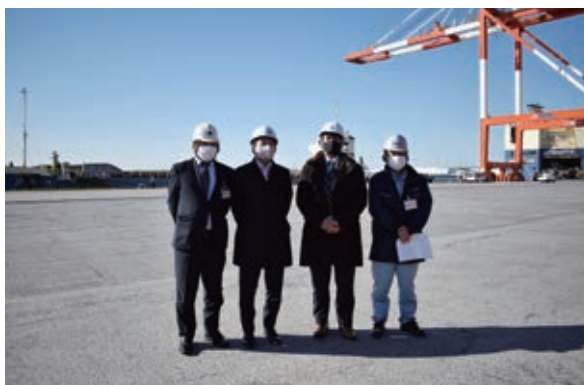
荷役作業の様子を見守る関係者