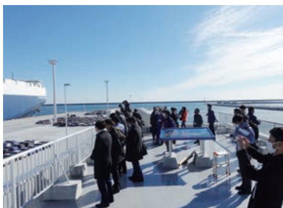
荷役作業の様子を見守る関係者