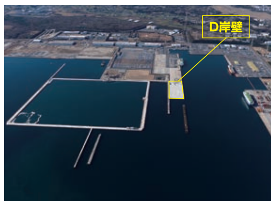
中央ふ頭地区水深12m岸壁(D岸壁)