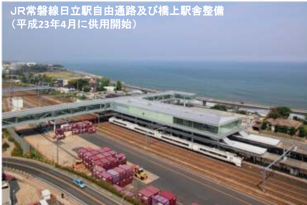
JR常磐線日立駅自由通路及び橋上駅舎整備 (平成23年4月に供用開始)

■日上市では、都市拠点性の強化を図るとともに交流人口を拡大し都市の活力を高めるため、日立駅周辺の整備を進めています。 日立駅東西の一体化を図るとともに都市拠点としての魅力を高めるため、自由通路及び橋上駅舎の整備とともに駅前広場や旧駅舎の跡地を活用した交流施設の整備等を一体的に進めています。