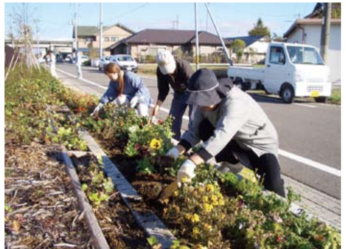
街づくり協議会による緑化活動