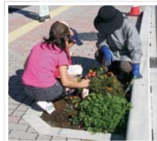
街路の植樹マスの緑化