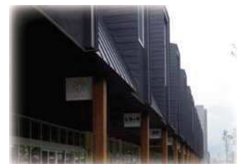
「オガール地区のデザイン」