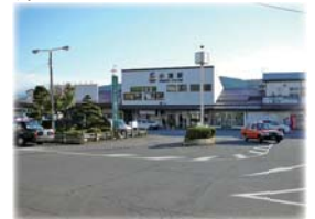
しなの鉄道『小諸駅』

小諸駅を中心とした中心市街地を「中心拠点区域」に位置づけ、老朽化した市庁舎および公共建築物の更新を契機として、市庁舎敷地の一部を小諸厚生総合病院の再構築移転場所として提供し、併せて地下を含めた高層化された集約駐車場等の整備を行い、中心市街地にコンパクトシティ実現のための都市機能を集約をしていました。