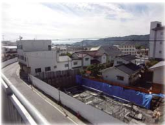
集約駐車場（建設中）