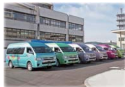
こもろ愛のりくん

地域公共交通、予約制相乗りタクシー『こもろ愛のりくん』のコールセンターは、駅前にある空き店舗を活用した待合室が一体となった施設で、そこを中心に5地区に分け地区ごとに色分けされた乗合タクシーが運行しています。電話が鳴り続くなか、モニターには予約状況が表示され、コールセンター前には次々と色鮮やかなタクシーが往来し常時5～6人が乗車していました。初めは、登録するのも面倒で、利用者も少なくて、定着するまで時間がかかりましたが、気軽に使ってもらうために、戸別訪問や町内会の集まりなどで根気強く説明をしたそうです。このように工夫次第で利用率が高くなるということが大事だと痛感しました。