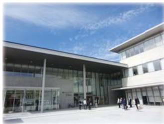
地域交流センター