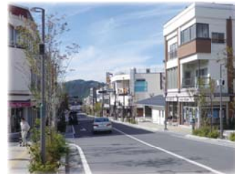
相生通り（無電柱化）