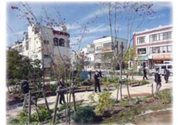
相生公園 （市民が植栽の維持管理）