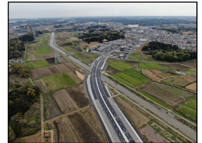
▲国道354号との交差点より