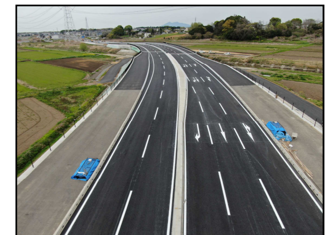
▲市道2級37号との交差点