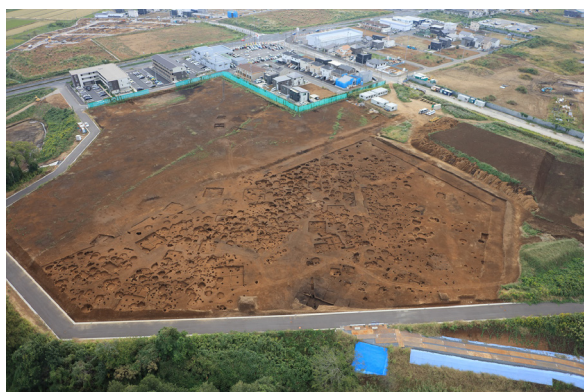
空から見た谷田部陣場西遺跡