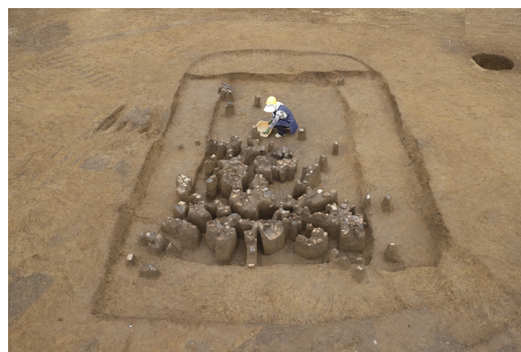
縄文土器が数多く出土した竪穴建物跡