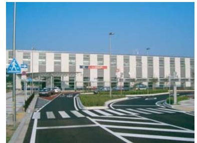
開業されたTX万博記念公園駅の様子

平成17年8月24日、午前5時7分、全線で最初となる始発電車、つくば発秋葉原行き区間快速が、満員の乗客を乗せて出発しました。開業1週間で105万人の乗降客となり、多くの人びとが沿線地域を訪れました。