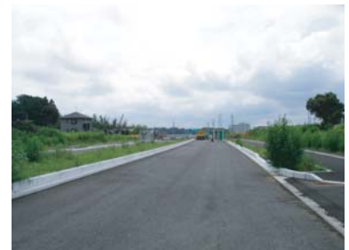
【地区外】島名上河原崎線工事状況(8月)