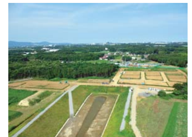
共同利用街区周辺の様子(7月)