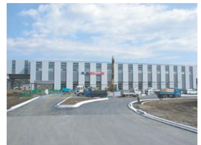
西口駅前広場工事状況

つくばエクスプレス沿線のまちづくりの魅力を首都圏に広くPRしていくため、茨城県とUR都市再生機構は地域の皆様との意見交換に基づき各地区の愛称を決定しました。