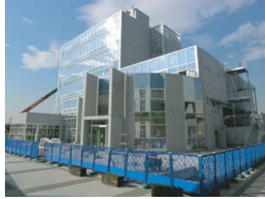
移転先のウィンズヒル

平成18年3月20日に、より地域に密着した対応が行えるように、茨城県県南都市建設事務所（現：茨城県つくばまちづくりセンター）が、万博記念公園駅西口に完成したウィンズヒルへ移転しました。