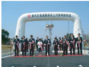
島名上河原崎線開通式

島名上河原崎線の開通式が平成19年3月28日に行われました。また、道路開通式とあわせて記念植樹も行われました。