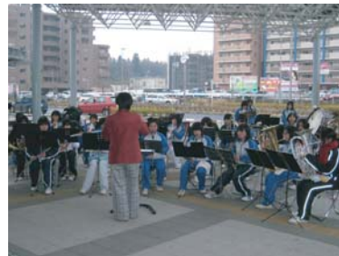
イベントの様子(高山中学校吹奏楽部による演奏)

平成19年12月22日に、万博記念公園駅前で「みんなのほっと！駅前イルミネーション スペシャルイベント」が行われました。駅前イルミネーションは平成19年12月8日～平成20年1月18日まで点灯されました。