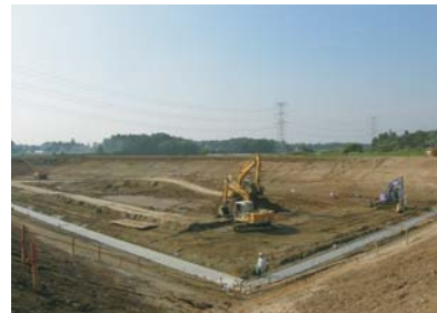
調整池工事の様子(10月)