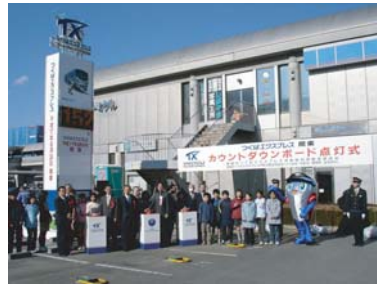
カウントダウンボード点灯式典

平成17年3月25日、TXつくば駅前では、「カウントダウンボード点灯式典」が行われ、カウントダウンボードに開業までの残り日数が点灯されました。TXマスコットキャラクターの「スピーフィ」も参加して、盛大な式典となりました。