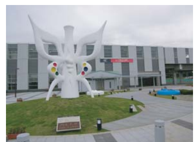
科学万博記念公園から東口駅前広場に岡本太郎氏作「みらいを視る」が移設されました