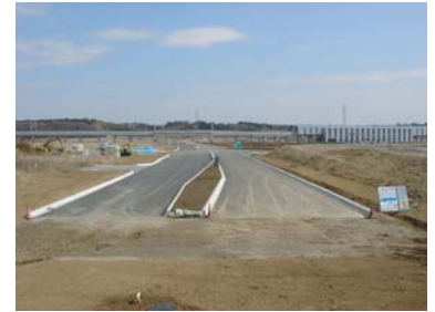
島名上河原崎線と駅周辺