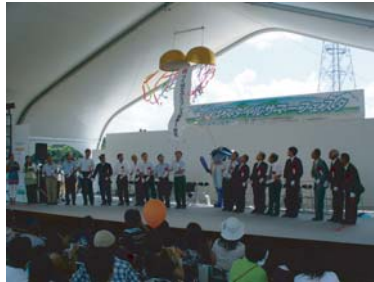
開業1周年イベント

平成17年8月のつくばエクスプレスの開業から1年が経過し、万博記念公園駅前においても建物の建築が進んできました。 8月19日～20日には、万博記念公園駅前で開業1周年イベントが開催されました。