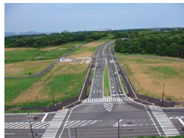
島名上河原崎線の沿道サービス街区の使用収益を開始(6月)

つくばエクスプレスの開業から約3年が経ち、島名上河原崎線の沿道サービス街区の使用収益が開始されるなど、事業が進められています。