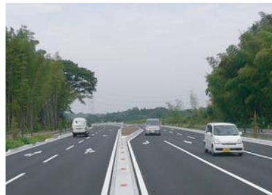
開通した島名上河原崎線の様子(6月)