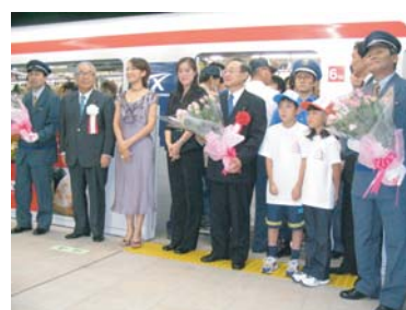
つくばエクスプレス開業

平成17年8月24日、午前5時7分、全線で最初となる始発電車、つくば発秋葉原行き区間快速が、満員の乗客を乗せて出発しました。開業1週間で105万人の乗降客となり、多くの人びとが沿線地域を訪れました。