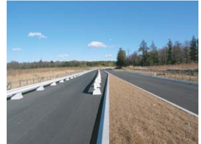
【地区内】島名上河原崎線工事状況(3月)