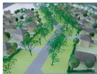
「つくば新集落」イメージ模型

今後は、この調査結果をもとに、「つくば新集落」導入について検討を行ってまいります。