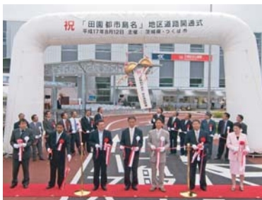
「田園都市島名」道路開通式

「田園都市島名」の駅周辺の県道と市道の開通式が平成17年8月12日に、万博記念公園駅の西口で行われました。また、開通式とあわせて記念植樹も行われました。