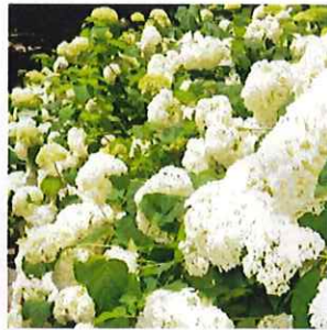
アジサイ“アナベル”