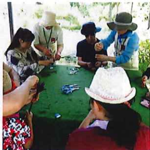
ラベンダースティックづくり

本公園の「香りの谷」では、ラベンダーの開花に合わせて『ハーブフェスティバル』を開催します。香りの谷は、砂丘ガーデンの最頂部からの谷間を利用した沈床花壇式ハーブガーデンで、120種類以上の様々なハーブを植栽しております。イベント当日は、香りの谷の手入れを行う公園ボランティア「ハーブパートナー」が、ハーブを使ったクラフトやクイズなどの体験を通して、奥深いハーブの魅力をご紹介します。