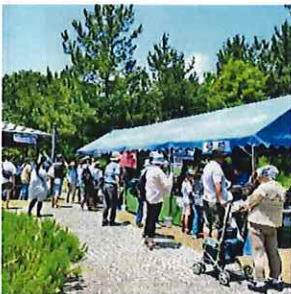
イベント開催時の様子