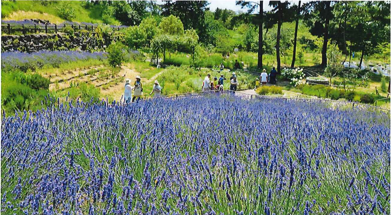
昨年の「香りの谷」の様子 2018年6月29日撮影