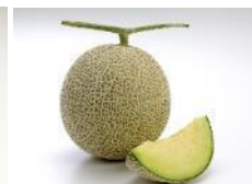
アールスメロン 8月上旬～11月上旬 秋に収穫されるメロン。 T字型のアンテナと綺 麗な網目の特徴。