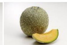
クインシーメロン 5月上旬～7月中旬 オレンジ色の果肉と まろやかな甘味。