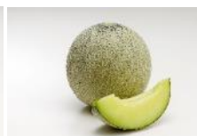
アンデスメロン 4月下旬～6月下旬 春メロンの代表格。 豊かな香りが人気。