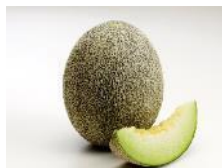
タカミメロン 6月上旬～7月上旬 縦長の形で日持ち するのが特徴。 しっかりとした食感。