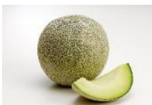
オトメメロン 4月中旬～5月上旬 春一番のメロン。 さわやかな甘さが特徴。