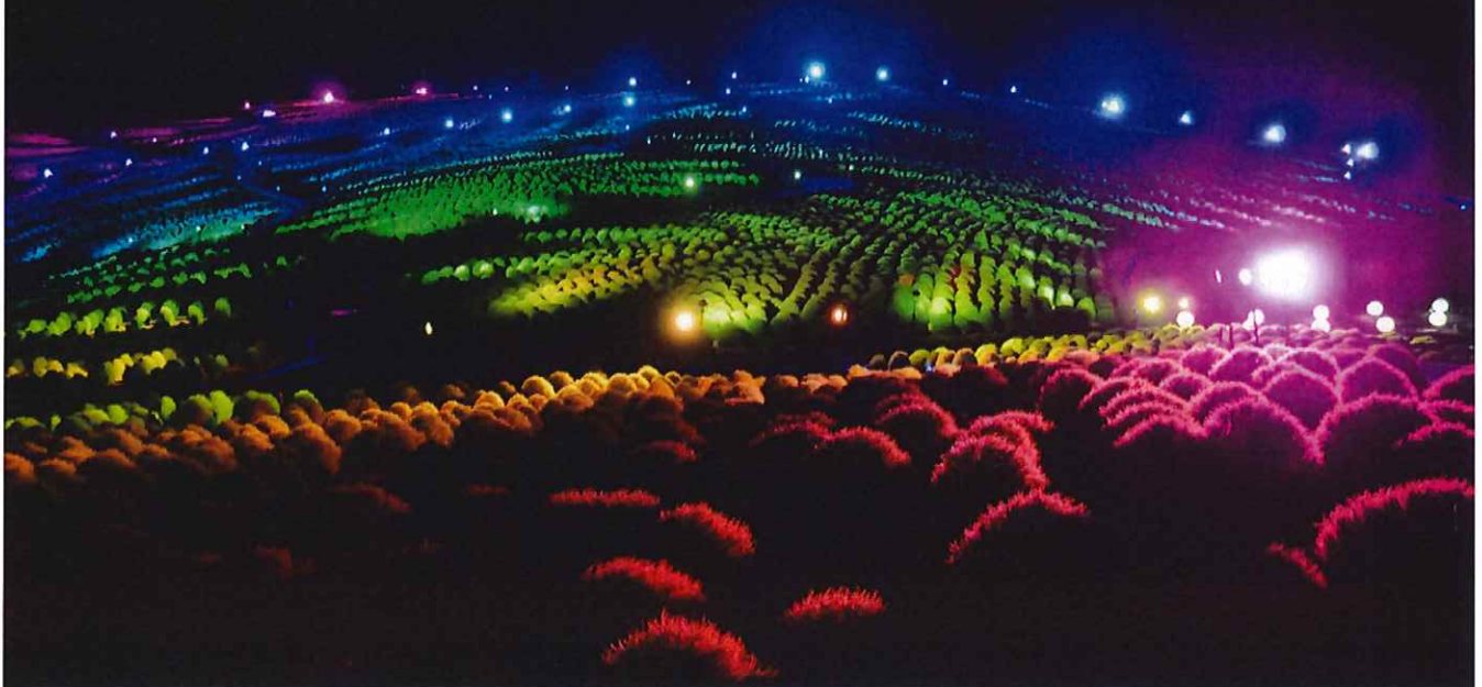
ライトアップの様子 2018年8月16日撮影