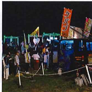
飲食も充実「ぐるめぐり」

夏の風物詩となった、本公園のコキアライトアップ。7回目の今年のテーマは「FINE」。宇宙・恋・愛・花・ヒーローの5つの物語を、カラフルな光と音で演出します。イベント期間中は、和太鼓や金管楽器によるライトアップステージ、食べ歩きにピッタリのおいしいグルメが目白押し。コキアきらめく特別な夜をお楽しみ下さい。