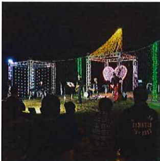
ステージイベントの様子