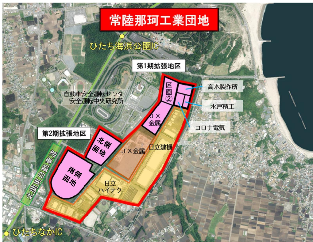
(参考) 常陸那珂工業団地拡張地区の全体図