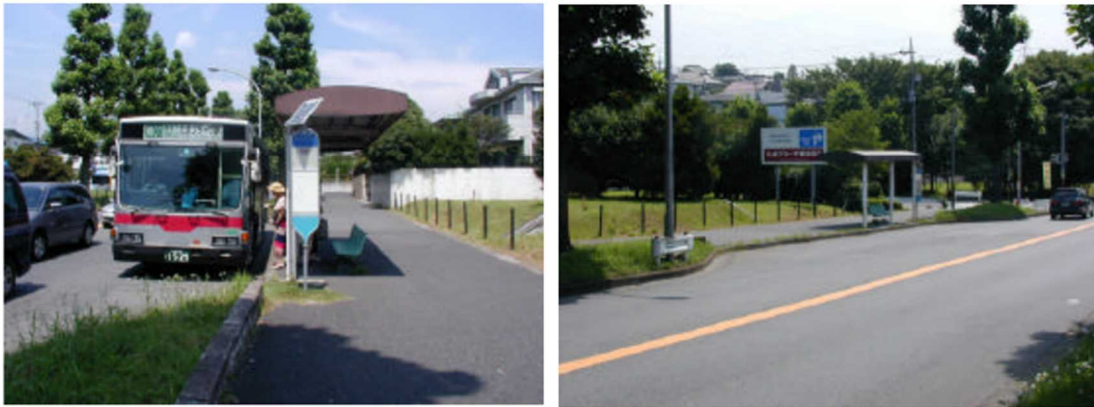
写真 4-2-1 神奈川県横浜市（植樹帯の幅員を活用してバスベイを設置）