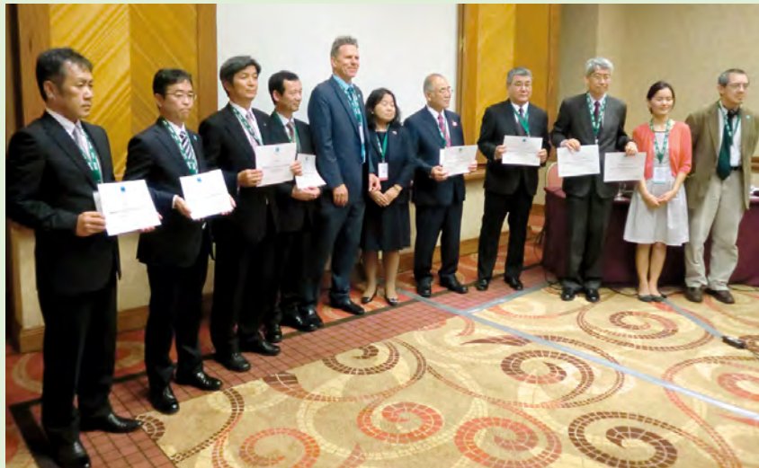
6月1日から9日にウルグアイで開催されたラムサール条約第12回締約国会議の会期中の6月3日に条約事務局から県及び地元3市町(鉾田市、茨城町、大洗町)に登録認定証が授与されました。