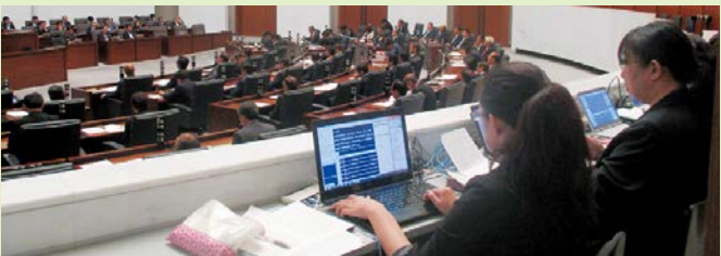
議場における要約筆記の様子

今定例会では、聴覚に障害のある方の議会傍聴に対応するため、9月9日の本会議・一般質問において、要約筆記を試験的に実施しました。議員の質問と執行部の答弁を要約して傍聴席のモニターに映し、5名の傍聴者が利用しました。