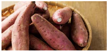
好調なかんしょ需要を逃さず取り込みを

議員 焼き芋や干し芋などが国内外で大変注目されている中、かんしょの生産拡大や干し芋事業への参入支援などにより、好調な需要を本県に取り込み、儲かる農業に導いていく必要があるが、所見は、農林水産部長 荒廃農地の再生支援などにより、県内加工業者の不足分の生産に必要な作付面積を拡大する。また、自ら干し芋事業に取り組みとする農業者に対して、加工技術や販路開拓などの支援を行い、儲かる農業の実現に努める。