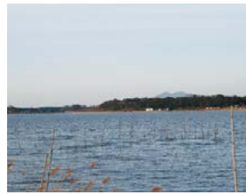
地域振興への活用が期待される牛久沼

議員 未開通の龍ヶ崎市八代町の竜ヶ崎潮来線から圏央道阿見東ICまでの美浦栄線バイパスと竜ヶ崎阿見線バイパスの整備見直しは、土木部長 今年度は残る竜ヶ崎潮来線から八代庄兵衛新田線までの区間の早期供用を目指し道路改良工事を進める。両バイパスは今年度国補助事業の新規採択を受け事業着手したところで、同時供用を目指し着実に整備を推進していく。(ほかに、利根町道一〇三号線の整備推進、龍ヶ崎市北竜台市街地への交番設置なども質問)