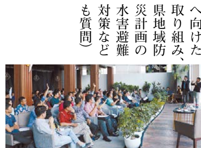
インドネシア人を対象とした本県就労セミナーの様相(インドネシア・ジャカルタ)

答 外国人雇用に向ききな企業から採択した集中支援企業を一貫して支援し、モデルケースを増やす中で、センターの機能強化も検討していく。