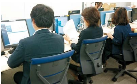
子どもたちのSOSをしっかりと受け止める相談体制の充実を(LINEでの相談対応)

議員 結婚観の変化などに的確に応え、新しい結婚の形とライフデザインを、若い方などへ広く提案していくべき。今後の結 茨城でのライフデザイン実現に向けた結婚サポート 議員 結婚観の変化などに的確に応え、新しい結婚の形とライフデザインを、若い方などへ広く提案していくべき。今後の結 結婚支援充実への取り組み 知事 高校生対象のライフデザインセミナー開催など、若い世代に結婚の素晴らしさを伝えるとともに、若者が利用しやすいマッチングシステム導入の検討など出会いの機会創出に努め、結婚支援充実に取り組んでいく。(ほかに、在留外国人材の活躍推進、SOGIハラスメント※2対策なども質問)