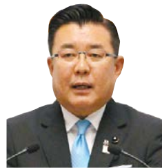
議員 伊沢 勝徳 いばらき自民党 土浦市選出 一括方式