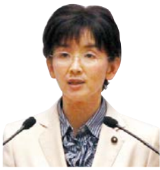
江尻 加那 議員 日本共産党 水戸市・城里町選出 一括方式