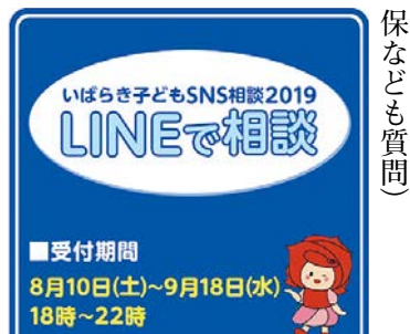
いばらき子どもSNS相談の継続を

問 SNSを活用した子どもの相談事業は、夏休み明けを含む四十日間を実施期間としている。気軽に相談ができ、有効な取り組みであることから、継続すべきだと考えるが、