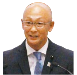
豊田 茂 議員 無所属 高萩市・北茨城市選出 一括方式