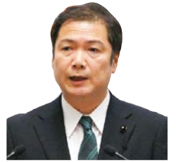
議員 玉造 順一 立憲民主党 水戸市・城里町選出 一括方式