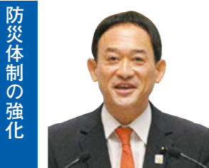
遠藤 実 議員 県民フォーラム 那珂市選出 一括方式

教育長 教職員にASUKAモデルを踏まえた実技を、児童生徒にAED操作を含めた指導をしている。今後とも同モデルを踏まえAED適正利用の普及啓発に努める。 (ほかに、主権者教育の充実、生活困窮者支援対策なども質問)