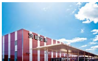
茨城空港のさらなる利用促進を

議員 教員の長時間勤務が全国的な課題となっている。熱意を持つ子どもたちの指導に当たるためにも、勤務環境の早急な改善が必要と考えるが、どう取り組むのか。 教育長 ウェブによる調査や運動部活動指導員の配置などにより、負担軽減を進めてきた。授業準備に多くの時間を費やしていることから、教材のデータベース化や焦点を絞った学習指導案の推奨などで授業準備の効率化を図っていく。 (ほかに、食の安全性、スマート農業 ※3 の推進なども質問)