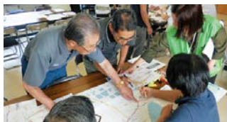
マイ・タイムライン作成ワークショップの実施状況

土木部長 市町村空家等対策連絡調整会議を設置し、空き家除却に係る事例集や空き家バンク設置手引書などを提供するとともに、国の財政的支援制度を周知し、活用を働き掛けてきた。今後も国と連携し市町村支援に取り組みしていく。 (ほかに、自殺防止対策、通学路の安全対策なども質問)