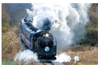
平成26年に運行された「SL奥久慈清流ライン号」

議員 水郡線のSL定期運行は、県北振興の大きな起爆剤となる。JRへの積極的な支援が必要だと考えるが、実現に向けて、今後どのように取り組んでいくのか。 政策企画部長 水郡線のSL定期運行は、多額の費用負担を考えると沿線地域における機運醸成や協力が必要となる。沿線自治体と合意形成を図り、JRとも協議を行いつつ、検討を進めていく。(ほかに、本県の目指す教育の在り方、県道常陸那珂港山方線の整備見直しなども質問)