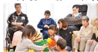
共生型サービスの推進を

議員 里親委託推進のため、フォスタリング機関 ※1 をどう整備していくのか。また、茨城県社会的養育推進計画の進捗状況は。 保健福祉部福祉担当部長 里親の資質向上のための里親研修や里親リクルート事業の実施により、フォスタリング機能を構築していく。茨城県社会的養育推進計画は今年度中に策定し、子どもの最善の利益実現に向け、里親委託推進など社会的養育の充実に取り組む。