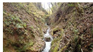
本県初の世界かんがい施設遺産「十石堀(じゅっこくぼり)」

議員 地域それぞれの医療現場の特性を踏まえた支援体制のもと、在宅医療の取り組みが推進されるべきと考えるが、所見は。 保健福祉部長 北茨城市の家庭医療センターのような医療機関の連携は、医師の負担軽減に有効であり、県の取り組みとしても複数の病院などのグループ化を進めた。また、全国で初めてICTを活用した遠隔診療のモデル事業も実施し、今後、活用を検討していく。(ほかに、医師不足対策、最終処分場の建設推進なども質問)