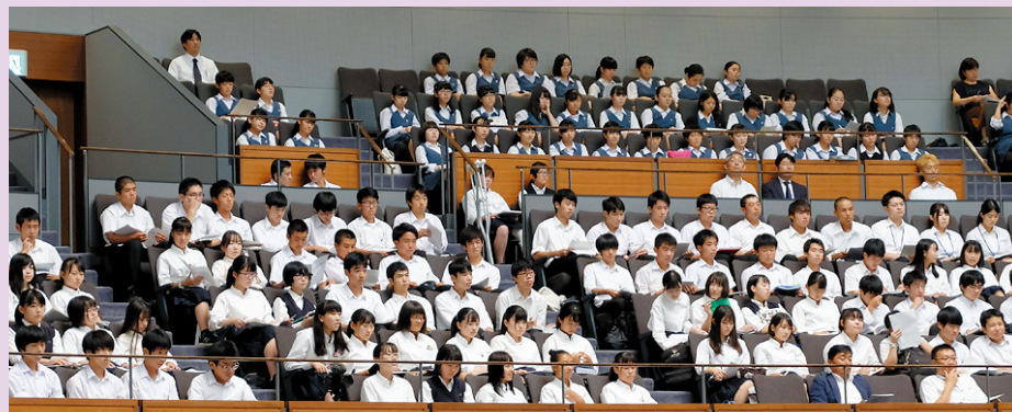
本会議での代表質問を傍聴する高校生

選挙権年齢の引き下げに伴い、主権者教育の重要性が高まっている中、茨城県議会では議会改革の一環として、平成27年第4回定例会以降、全ての定例会で高校生の議会傍聴を受け入れています。教育庁などとの連携の下、今定例会においても、多くの高校生が県議会本会議を傍聴しました。 (議会傍聴お問い合わせ先：議会事務局議事課 電話：029-301-5634)