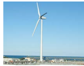
再生可能エネルギーの円滑な導入

議員 送電線の空き容量不足により、県内のほぼ全域で再生可能エネルギー発電設備の新規接続が停止されたが、今後の県の方針は。 県民生活環境部長 新規の設備を速やかに稼働させていくことが重要であるため、送電線の増強策を国に要望している。再生可能エネルギーは、地域のエネルギー供給の強靱化や地域活性化の観点からも重要であり、導入が円滑に進むよう引き続き取り組んでいく。