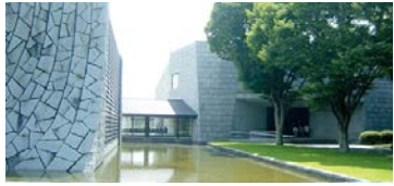
茨城の魅力を発信する歴史館へ

議員 障害を持った生徒も健常者と同様に県立高校へチャレンジできる環境が必要と考える。エレベーター設置など、バリアフリーに対応した環境整備について伺う。 教育長 エレベーターの設置は生徒の障害の状況などにより必要に応じて個別に検討していく。多目的トイレは今定例会に補正予算案を提出し、整備を進める。誰もが安心して高校生活が送れるよう教育環境の充実に取り組む。 (ほかに、郵便局との連携強化、難聴児の発達の支援なども質問)