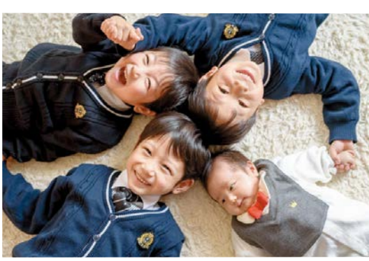
子どもが健やかに育つ環境を

議員 「親亡き後」も見据え、障害のある方々が、障害の程度や内容に応じて、自らにふさわしい居場所を十分に確保することができるよう、今後、どのように取り組んでいくのか。 知事 障害者一人一人の希望に沿って、さまざまなサービスや地域資源を効果的に組み合わせ、プランニングする相談支援専門員の養成や、地域における居住支援のための機能を集約した「地域生活支援拠点」整備の市町村への働き掛けなどを通じて、きめ細かな支援の提供が可能な居場所づくりを進めていく。