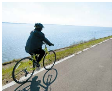
湖面がきらめくつくば霞ヶ浦りんりんロード

問 つくば霞ヶ浦りんりんロードがナショナルサイクルルート ※1 の第一次候補ルートに選定された。市町村も含めた現在の整備状況は。