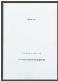
3月公表のいじめ自死調査報告書

議員 原発直下の地震リスクをどう評価しているのか。原子炉建屋内のプールに残る核燃料棒はキャスク ※1 に移すべきである。地震やテロに伴うリスクから県民を守るため廃炉すべきと考えるが所見は。 知事 日本原電 ※2 から地震の評価を聴取し、検証結果を県民に示したい。使用済燃料は貯蔵施設で長期保管をせず、計画どおり搬出されるよう国や事業者と働き掛ける。再稼働は県民意見を聞き判断する。(ほかに、最低賃金引き上げと支援策、選択的夫婦別姓なども質問)