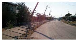
大規模停電対策の推進を(大規模停電が発生した東日本大震災時の県内の様子)

県警本部長 昨年、車間距離保持義務違反を前年の三・四倍となる百三十一件検挙した。今後とも、あらゆる法令を駆使した厳正な捜査や取り締まりのほか、交通安全教育や広報啓発活動を推進していく。 (ほかに、営生沼周辺地域における交流人口の拡大、夜間中学設置に向けた支援なども質問)