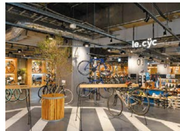
レンタサイクル施設の整備も進むつくば霞ヶ浦りんりんロード(写真はりんりんスクエア土浦の様子)

答 県としては、国から示された指定要件を概ね満たしていること認識している。本指定に向け、ハード・ソフト両面からの取り組みを推進し、国内外からの観光誘客につなげていく。