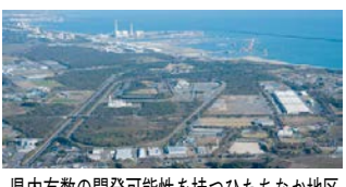
県内有数の開発可能性を持つひたちなか地区

議員 現在、ひたちなか市には分譲できる工業用地がないが、港湾整備やひたちなか大洗リゾート構想の進捗に伴い、企業進出が見込める。現状をどう認識し、新たな工業団地造成にどう取り組むのか。知事 ひたちなか地区は県内有数の開発可能性を持つ地域である。今後、未利用の国有地で新たな工業団地を確保し、企業を誘致することは重要と考える。工業団地が確実に整備されるよう市との連携体制のさらなる強化に努めていく。