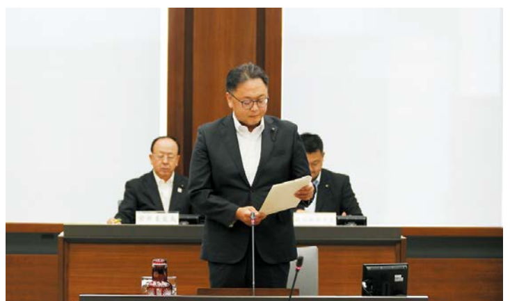
9月20日に行われた予算特別委員会の様子

QRコードを掲載しました 代表質問者一覧(二面)、一般質問者一覧(四面)及び予算特別委員会質問者一覧(八面)にQRコードを掲載しました。こちらから質問などの録画映像がご覧いただけます。 ※QRコードは機読センサーウェブの登録商標です。