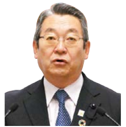
八島 功男 議員 公明党 土浦市選出 一括方式

議員 認知症施策の柱は共生と予防であり、特に「共生」を進める上で、生活支援ニーズに定める施策が重要である。超高齢社会を展望し、認知症対策にどう取り組むのか。 知事 共生に向けた取り組みとして認知症サポーターの活躍の場を広げるとともに、認知症の方が自ら相談や仲間づくりをする活動の推進など、認知症になっても自分らしく暮らし続けられる社会の実現を目指す。また、「元気アップ!りいばらき」※1の活用など、認知症予防につながる取り組みも充実させていく。