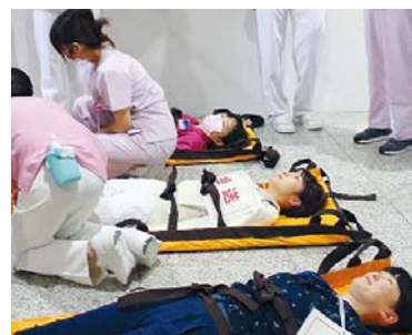
県立中央病院での防災訓練

答 カード形式を選択することでメリットがある一方、優遇措置を受けるための記載ができなくなるというデメリットもある。カード化については、交付事務を行っている市町村の意見も踏まえてしっかりと検討していきたい。