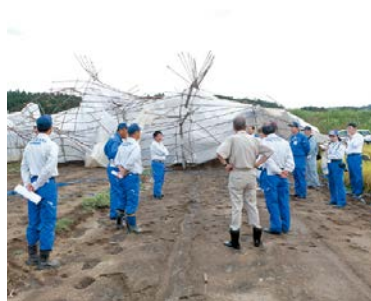
台風第15号被害を受けたハウスを視察する委員の様子(水戸市)

問 本県の野生イノシシにおける豚コレラ検査状況は。また、本県での豚コレラ発生も想定し、危機感を持って、出来るだけ早く防護柵設置を進めるべきではないか。