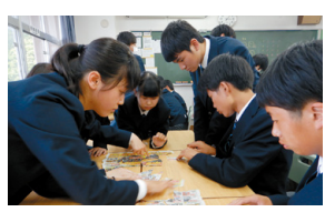
ライフスキル教育の授業の様子