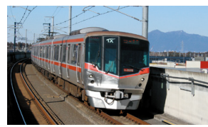
TX8両化の早期実現を

(ほかに、特別支援学校の今後の教育環境の整備、青色防犯パトロール活動の推進なども質問)