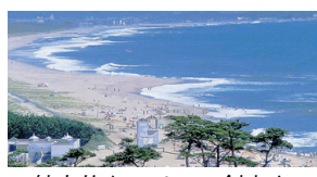
魅力的なエリアの創出を (快水浴場百選の伊師浜海岸)