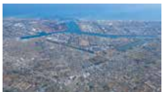
クリーンエネルギー拠点の構築を目指す鹿島臨海工業地帯

知事 200億円の基金など県独自の支援とともに、国の支援も最大限に活用しながら、民間企業の取組を強力に後押しし、将来にわたって本県産業の基盤となる水素などのクリーンエネルギー拠点を茨城港および鹿島港に構築すべく、全力で取り組んでいく。