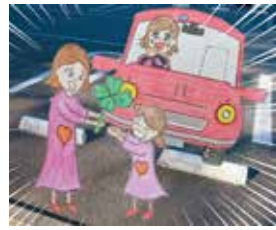
踏み間違い サポカー普及で 防ごうよ