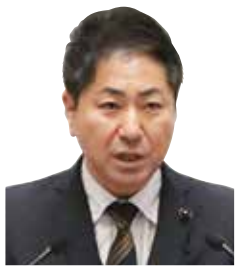
瀬谷 幸伸 議員 いばらき自民党 日立市選出