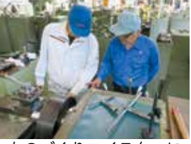
ものづくりマイスターによる技術指導の様子

ものづくりマイスター制度の普及拡大 議員 ものづくりマイスター制度の普及拡大に向け、PR動画の制作やジュニア技能インターンシップ ※2 の拡充などの検討を含め、どう取り組むのか。 産業戦略部長 マイスターの高度な技能や職人のやりがいを伝える動画の制作を進めている。インターンシップは今回制作する動画も活用し、生徒や学校関係者の関心を高め、参加を働き掛けていく。 (ほかに、鹿島港の港湾機能の強化、安心して利用できる障害児通所支援体制の構築なども質問)