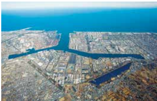
さらなる競争力強化が図られる鹿島臨海工業地帯

答 前者の事業では、都内窓口での移住相談対応やセミナーなどを通じ、本県の優位性をPRし、移住を推進している。後者の事業は国の交付金を活用し、東京圏から移住される方に支援金を支給するものであり、令和7年度は70件ほどの支給を見込んでいる。(ほかに、令和8年度以降のひたちなか大洗リゾート構想の取り組み、財政運営状況と今後の見通しなども質問)