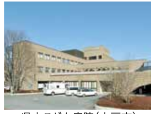
県立こども病院(水戸市)

水戸保健医療圏の病院再編 議員 県民、利用者参加での地域医療づくりについて、見解は。 保健医療部長 新県立病院整備検討委員会には、小児・成人両方の患者関係団体の代表者も委員として参画し、利用者からの意見も反映できる体制としている。今後も基本計画を策定する中でパブリックコメントを実施するなど、幅広く県民の意見を聴取していく。 (ほかに、実効性のある広域避難計画に向けた検討状況と課題、畜産振興と常陸牛のブランド化推進なども質問)