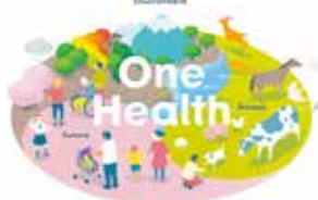
ワンヘルスのイメージ※3