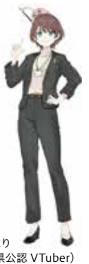
茨ひより (茨城県公認VTuber)