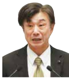
大足 光司 議員 国民民主党 高萩市・北茨城市選出