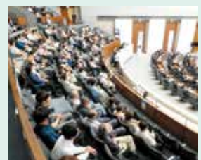
本会議場の傍聴席の様子

その他、団体での傍聴や常任委員会の傍聴などの詳細については、県議会事務局議事課までお問い合わせください。