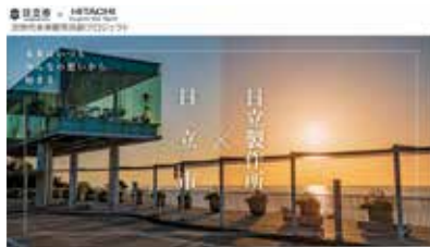
日立市と日立製作所が進める「共創プロジェクト」

教育長 新たなプランでは、「次世代を担う人材」、「魅力ある教育環境」を柱に、時代や社会の変化への対応に重点を置いた施策を進める。不登校対策の取り組みの成果として、本県は、全国で唯一、不登校児童生徒数が2年連続で減少している。引き続き、多様な学びの場や居場所の確保に取り組んでいく。(ほかに、本県の財政、水産業振興における海水温上昇対策なども質問)