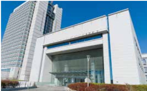
全ての県民の「幸せ」実現に向けた県政運営 (県議会棟と県庁舎)

知事 新しい県総合計画では重点的取り組みとして、他地域にはない差別化、将来の発展を見据えたインフラ投資、多様な人材が活躍できる社会を掲げた。安心安全の分野では、犯罪の抑止と検挙を強力に推進する。県民一人一人が未来に希望を持ち、挑戦を続けられることが「幸せ」だと考えており、そうした環境の充実に向けて全力で取り組む。