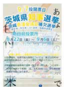
昨年の県知事選挙の際に県内の全高校に配布されたチラシ

警察本部長 警察官の定員は政令で定める基準に従い条例で定めることとされている。情勢の変化に応じた見直しが必要だが、本県警察官一人当たり1.5人程度の負担は依然として全国の中でも高い水準にあることから、本県警察の厳しい現状を国に伝え、基準の見直しを要望していく。(ほかに、第2次高市内閣発足と今後の県政運営、県立高等学校改革プランに係る評価と次期プランの策定なども質問)