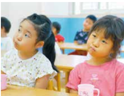
フッ化物洗口を実施している様子

(ほかに、新県立病院整備に伴う県立子ども病院の医療機能の維持強化、生活保護受給者や生活困窮者の自立に向けた支援なども質問)