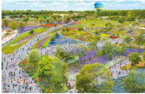
国際園芸博覧会会場イメージ

答 常陸乃国(ひたちなか)いせ海老や常陸国(ひたちなか)天然まがもなど、食の魅力に加え、ネモフィラ、コキアなどの花絶景、韓国で人気がある