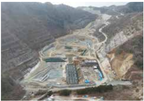
新産業廃棄物最終処分場の整備状況(日立市)

答 パーティションメントの確保や公立小中学校体育館への空調設備の導入促進、関係事業者との災害時応援協定によるトイレ・入浴環境の確保などの取り組みにより、良好な避難所環境の確保に努める。(ほかに、災害情報提供アプリの概要と周知方法、茨城県交通安全計画における自転車の安全通行確保の考え方なども質問)