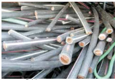
窃取された銅線ケーブル

問 土浦市桜町の違法風俗店が匿名・流動型犯罪グループの資金源となっていたのか。また、資金獲得活動を断つため、繁華街対策をどう強化していくのか。 答 当該事案では組織的犯罪処罰法違反で検挙し、犯罪収益を剥奪した。関係部署が一体となり、取り締まりや周辺自治体との連携を進めていく。 (ほかに、体育館のエアコンの設置状況、県警における女性の働きやすい職場づくりなども質問)