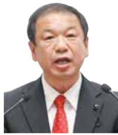
高橋 勝則 議員 いばらき自民党 古河市選出