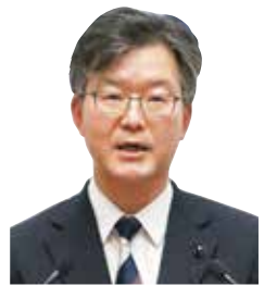
村本 修司 議員 公明党 公日市選出