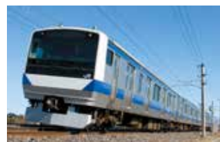
広域交通ネットワークの中心となるJR常磐線

議員 利根町では、4千人近い留学生により、地元住民が不安になっている。専門学校の設置認可をしている県に留学生の生活環境への責務はないのか。留学生を受け入れている学校の責務はどうか。教育長 法令の規定はないが、国の通知を踏まえ学校設置者に一定の責務があると考えられる。県は必要な助言などを行っているが、改めて適切な対応の徹底を求めていく。(ほかに、ギャンブル等依存症対策、県内下水道の状況と今後の対応なども質問)