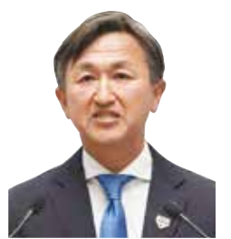
坂本 隆司 議員 いばらき自民党 龍ヶ崎市・利根町選出