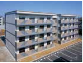
建て替えをした県営住宅(水戸市)

県営住宅の入居環境の改善 議員 古い県営住宅への風呂釜・浴槽の設置促進、60歳未満の単身入居の実績、連帯保証人の確保が困難な方への対応の状況は。 土木部長 風呂釜・浴槽は応募の多い団地などから引き続き設置を進める。60歳未満の単身入居は条例改正以降74件の実績がある。連帯保証人の確保が困難な方には、法人保証制度や免除により、入居を妨げないよう取り組む。 (ほかに、東海第二原発の再稼働問題、自衛隊百里基地の機能強化に関する住民説明なども質問)