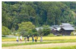
県北地域の里山風景

議員 県内各地の地場産業は、県の文化的アイデンティティを象徴する重要な資産である。伝統工芸品の魅力発信、販路拡大による地場産業振興にどう取り組むのか。産業戦略部長 地場産業は地域経済の発展に資する重要なものと考えられる。県内外での展示販売会の開催や新たな技術の開発などを通じ、地場産業の振興に取り組んでいく。(ほかに、SNS起因の犯罪から子どもを守る未然防止策と被害児童生徒への支援体制の充実、孤立集落の防災対策なども質問)