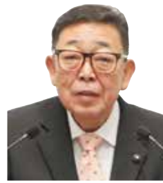
戸井田 和之 議員 いばらき 自民党 石岡市 選出