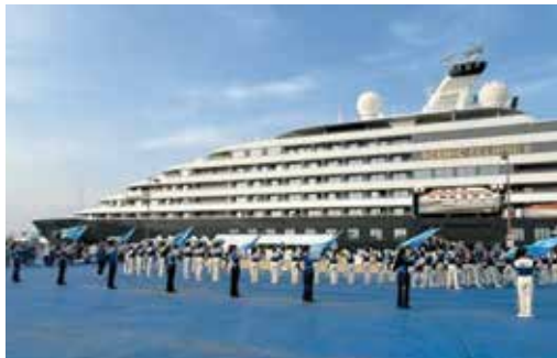
クルーズ船寄港(茨城港大洗港区)

問 水道の経営統合に係る基本協定を締結した28団体には大規模な水戸やつくばなどが入っており、今後、人口減少により、経営が厳しくなることが予想され、県の負担増大が懸念されるが、所見は。 答 協定締結した28団体と県との間では、経理を区分し、それぞれの会計からの補填はせず、今後の投資に要する財源については、次年度計画を作成する中で検討する。