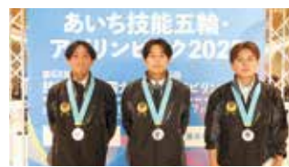
第63回技能五輪全国大会 (愛知県開催)の県内企業の銀賞受賞者

議員 自分の技能に夢をかける青年を育成するため、経済支援の拡充などが重要と考えるが、所見は。産業戦略部長 出場選手への現行の支援に加え、今後は、これまでの出場者が大企業中心となっていた職種に新たに中小企業から出場した場合の支援の充実を協会と協議する。また、訓練環境の構築を検討するなど、技能五輪を契機に企業と協力し、人材育成に取り組む。(ほかに、「地域共生型コンビニ」の導入、いじめの被害児童生徒への継続的支援体制なども質問)