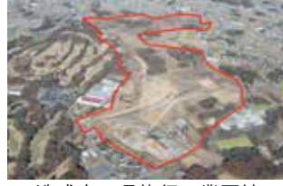
造成中の県施行工業団地坂東フロンティアパーク

児童虐待対応 議員 児童虐待の相談件数が増加する中、事案への早期対応に向け、医療機関などの関係機関との緊密な連携が必要と考えるが、所見は。 福祉部長 関係機関との連携は重要であり、「茨城県要保護児童対策地域協議会」などを通じ、情報共有に努めている。今後、医療機関とのさらなる連携強化に向け、医療側、市町村側に働き掛けを行うほか、医療機関同士のネットワーク形成の必要性も含め検討を進める。 (ほかに、農地管理、金融教育なども質問)