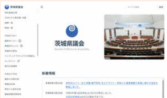
茨城県議会ホームページ

今後とも、県議会への理解と関心を深めていただけるよう、より充実した情報発信に努めてまいります。