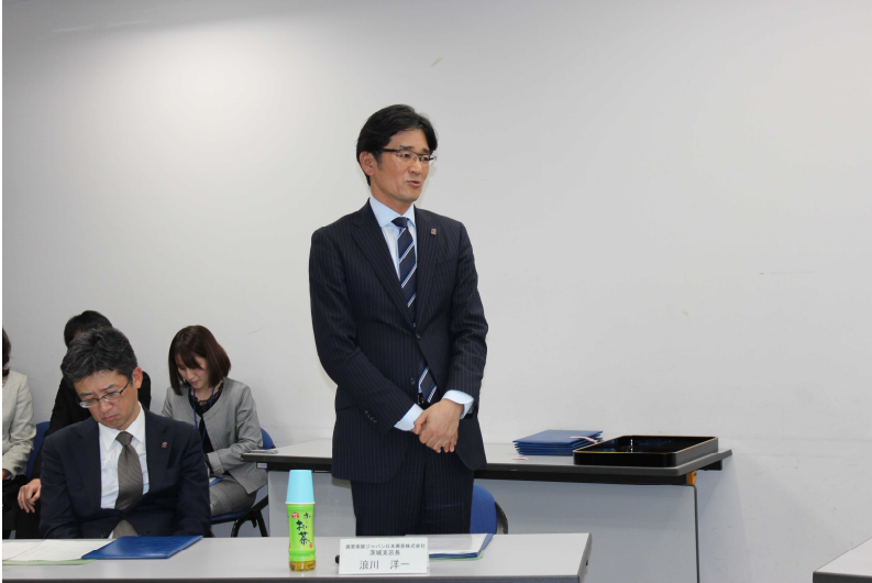
損保ジャパン日本興亜ひまわり生命保険株式会社 加世田関東統括部長