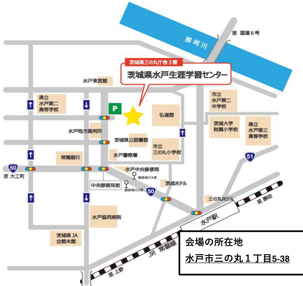
水戸生涯学習センター平面図（茨城県三の丸庁舎3階）