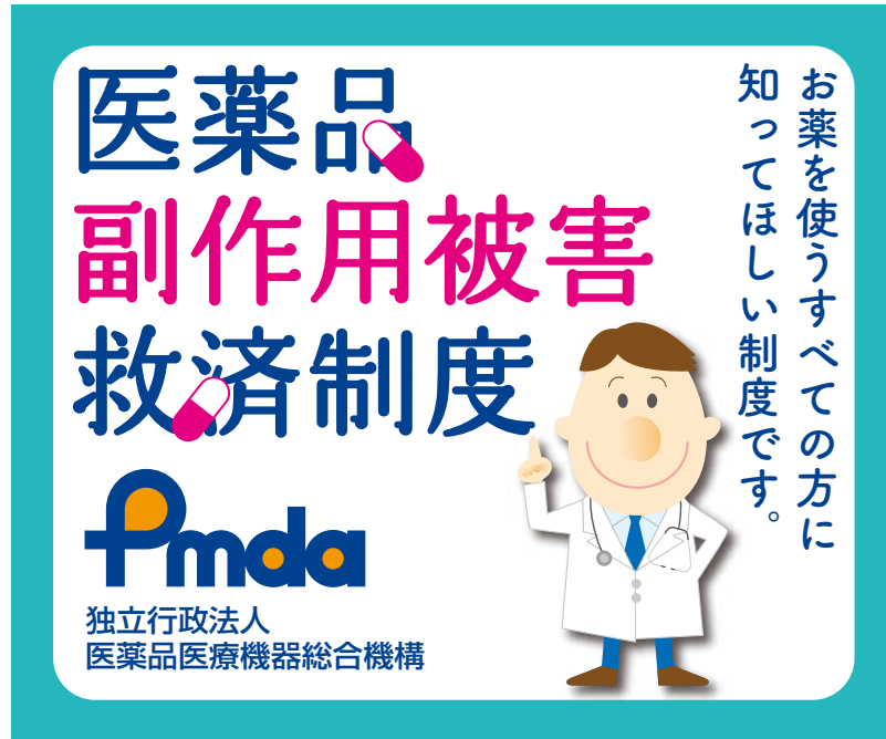
⑤レクタングル / 左右 300pix × 天地 250pix