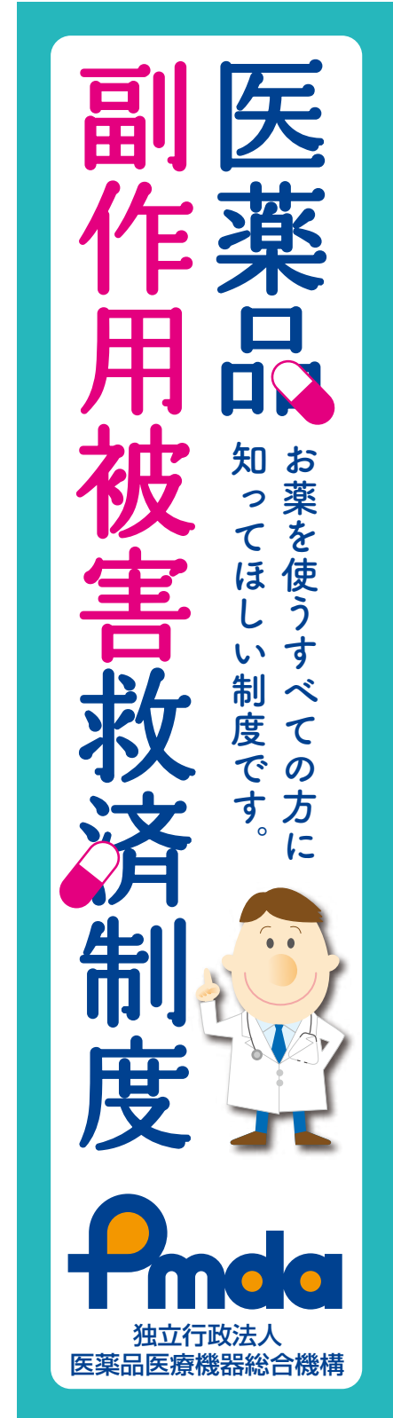
④ワイドスカイスクレイパー / 左右 160pix × 天地 600pix