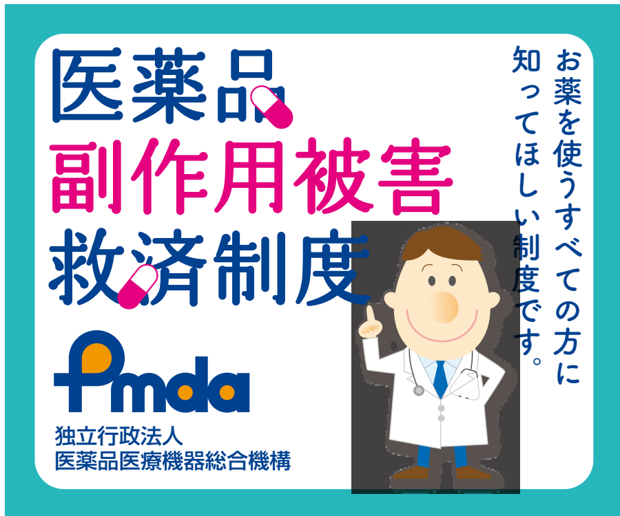
①レクタングル（大） / 左右 336pix × 天地 280pix