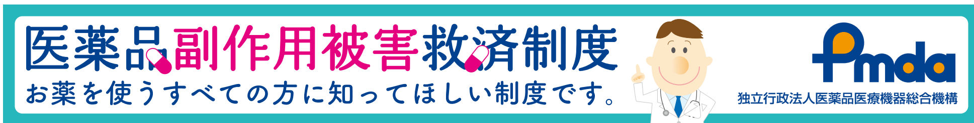
③ビッグバナー / 左右 728pix × 天地 90pix