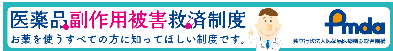
②バナー / 左右 468pix × 天地 60pix