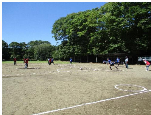
フットソフトボール