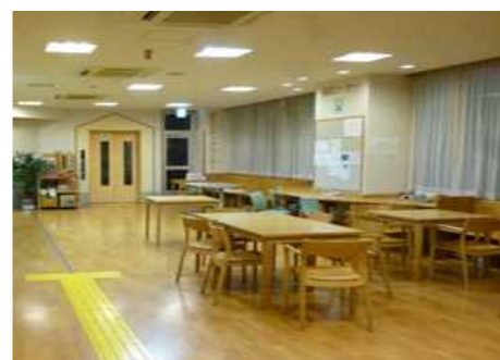
日中活動スペース