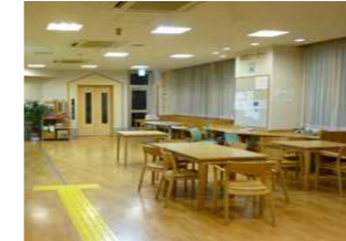
日中活動スペース