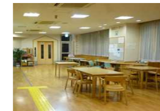
日中活動スペース