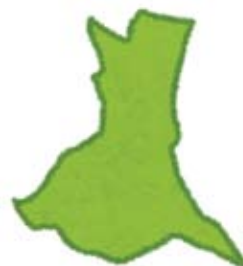
その他 県が認めたもの