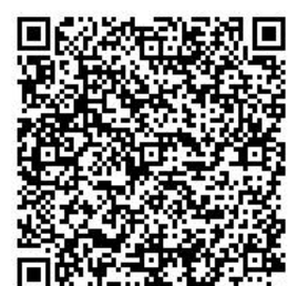
宿泊施設での療養について/県HP