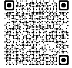
自宅療養中の方向けの情報/県HP