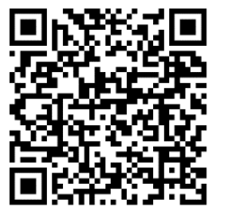
罹患後症状(いわゆる後遺症)について/県HP