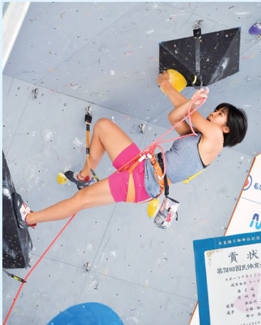
少女女子の森(上)・菊池(下)組は、ボルダリング、リードの決勝に進み、2種目とも2位となった