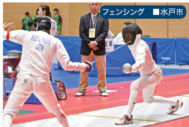
フェンシング ■ 水戸市