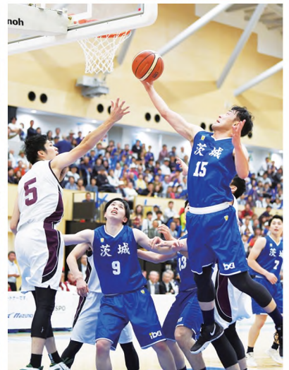
決勝で秋田に敗れ、惜しくも2位の本県選抜