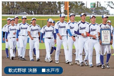
軟式野球 決勝 ■ 水戸市