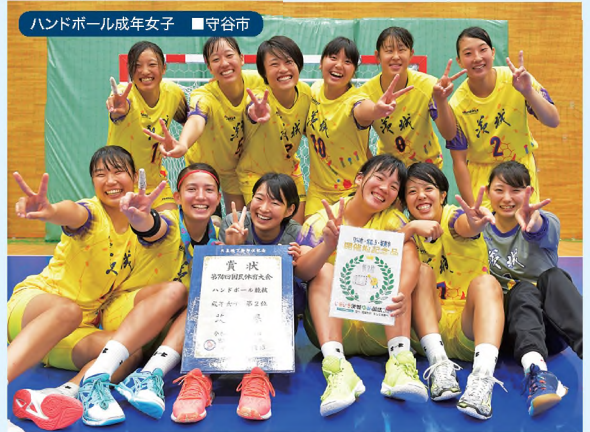
ハンドボール成年女子 ■ 守谷市