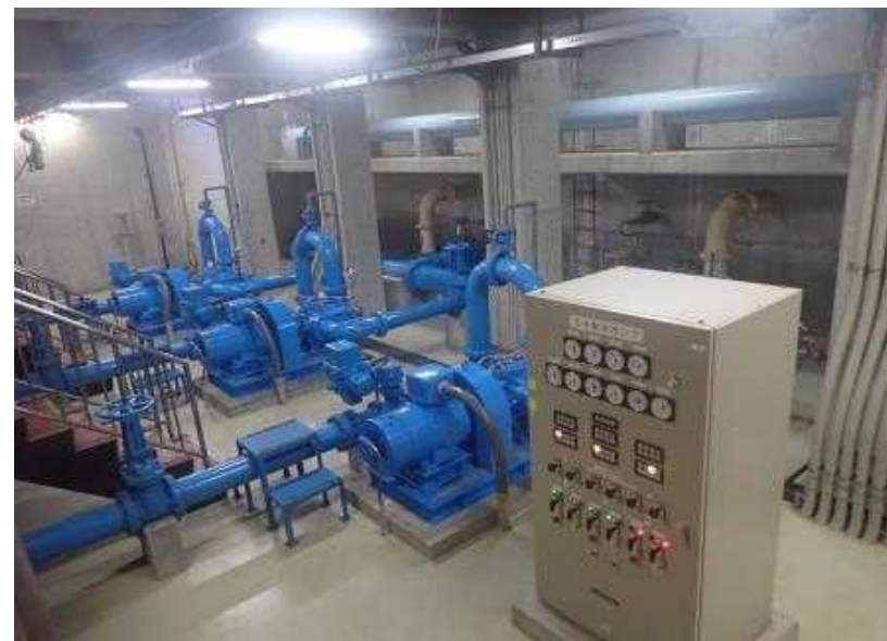
送水ポンプ（作った水を送る）