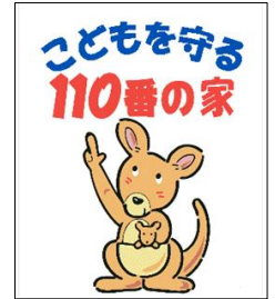
こどもを守る110番の家

【ポイント2】 「安全な場所」： 何かあったら助けを求めることができる(逃げ込める)ところ (例えば) こどもを守る110番の家や店(コンビニ、ガソリンスタンドなど) 学校、学習じゅく、警察署(交番・ちゅうざい所)