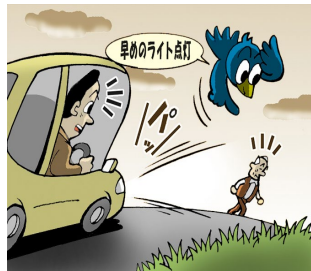
早めのライト点灯！