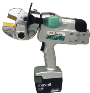
電気装置及び油圧装置を備えたボルトクリッパー