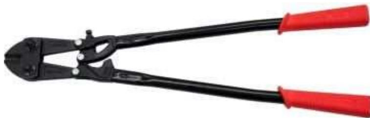
手動両手式のボルトクリッパー

なお、ボルトクリッパーという商品名で販売されていなかったとしても、鉄筋等の鋼材を切断するための工具として設計、製造又は販売されているものについては、ボルトクリッパーに該当する。