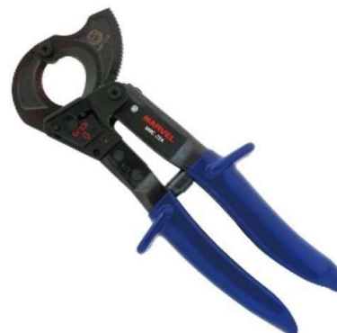
(左) 手動両手式のケーブルカッター