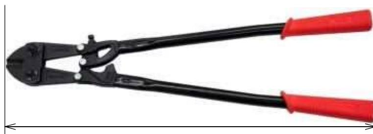
ボルトクリッパーの「長さ」

なお、ラチェット機構を備えているボルトクリッパーは、現時点、国内でほとんど流通しておらず、また、唯一警察庁で把握している製品も全長が75センチメートルを超えていることから、独立した要件としては設けていない。