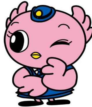
県警マスコットキャラクター こひばりちゃん