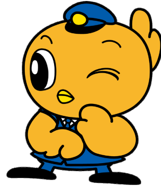
県警マスコットキャラクター こひばりくん