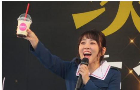
▲茨城をたべよう収穫祭でガルパン声優がステージで実食