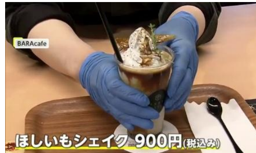
▲フジテレビ「イット！」のほしいも特集内で紹介