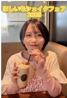
▲加藤里保菜さんによるInstagram投稿