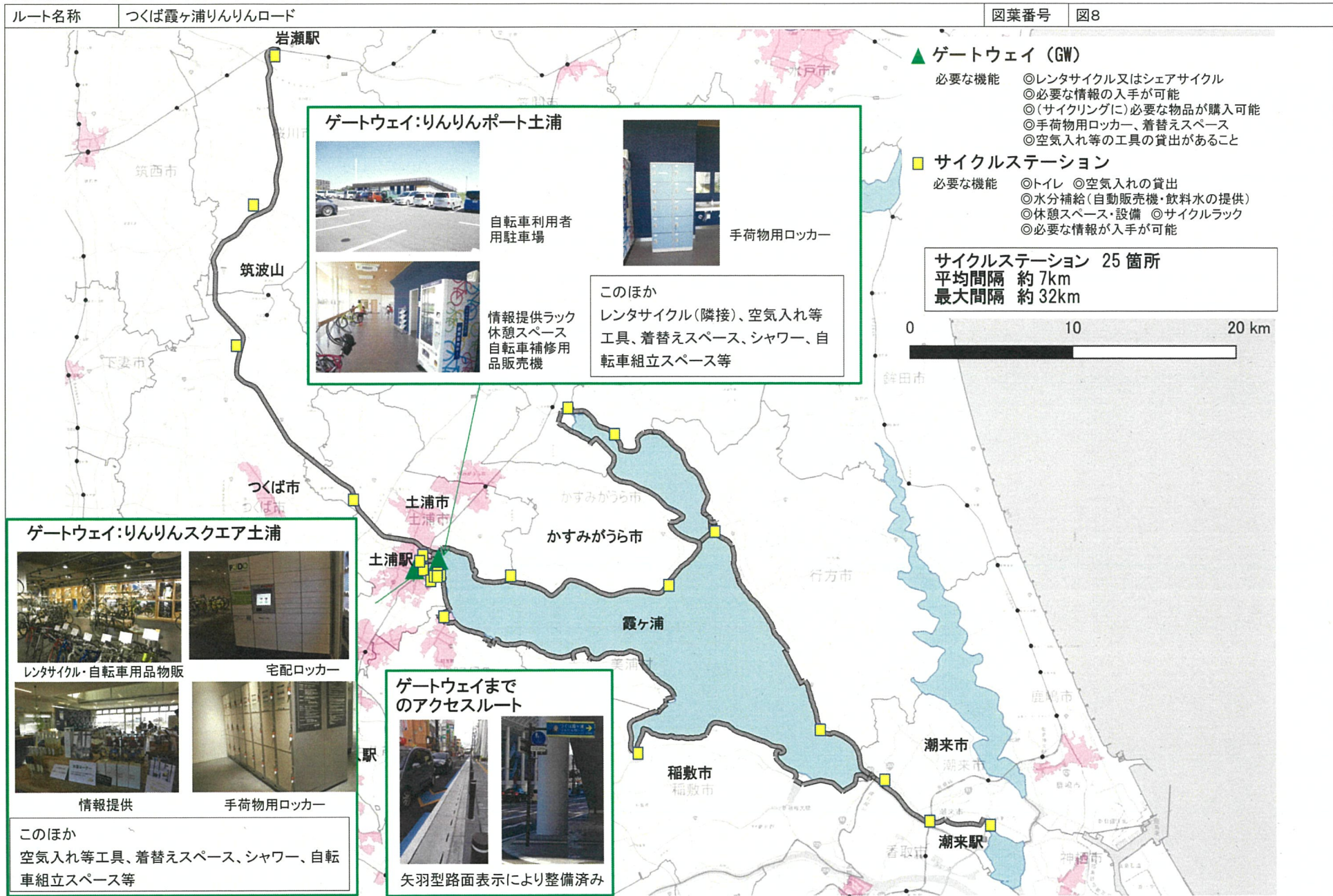
受入環境(ゲートウェイ・サイクルステーション)位置図