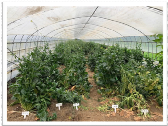
CTRL, 10M, 5M, 1hr, 2hr 照射(後期)

コマツナにおいては成熟時点での形態に明らかな変化が現れ、照射時間が長いものほど矮性が出現する割合が高い傾向が見られた。また、花卉や葉における異常が出現し、これらが突然変異に由来する事象であることが推定できた。