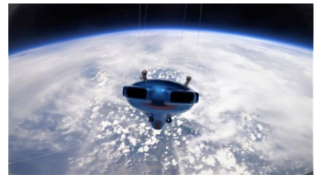
同社が茨城県沖上空32,000mで撮影した有人飛行キャビンのミニチュアモデル