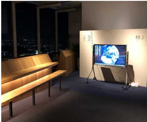
(テストの様子) ※当日は、脇に説明パネルを設置