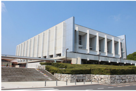
茨城県立県民文化センター