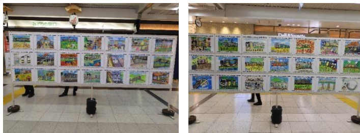
駅での展示の様子（水戸駅）