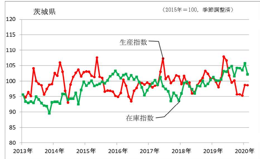
鉱工業生産指数、在庫指数の推移