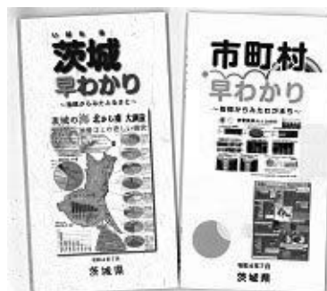
茨城早わかり/市町村早わかり