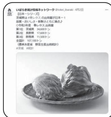
令和5年4月2日 春レタスの出荷量のTwitter投稿